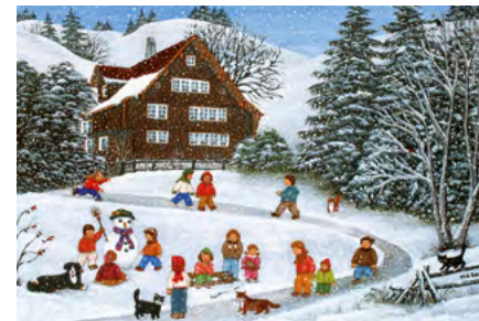
© Heidi Steinemann, Switzerland - Appenzell