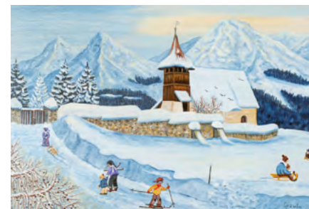
© Ursula Stadler-Lanker, Switzerland - Arosa GR