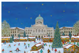
© Anita Rüfenacht, Switzerland - Bern