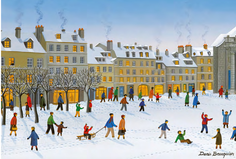
© Denis Bauquier, France - Place St.Pierre - Besançon