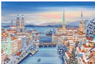
© Ursula Stadler-Lanker, Switzerland - Zürich