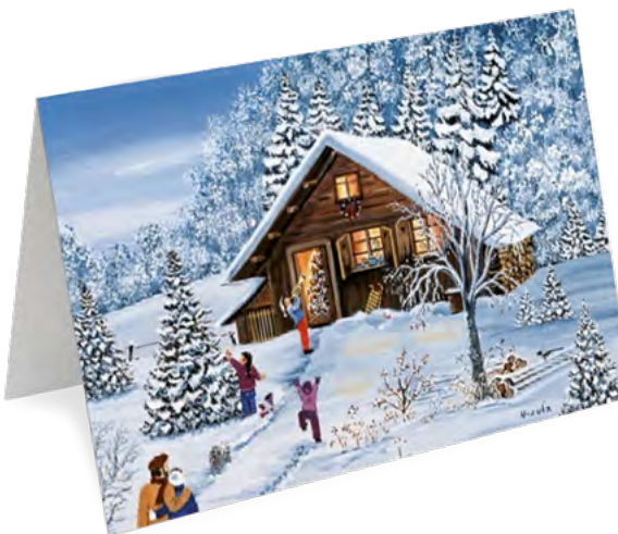
© Ursula Stadler-Lanker, Switzerland - Zürcher Oberland