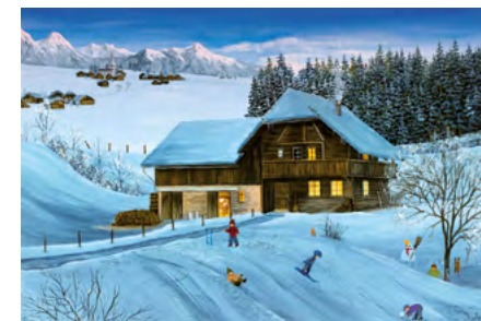
© Marguerite Hofer, Switzerland - Berner Oberland