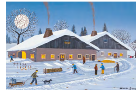
© Denis Bauquier, France - Französischer Jura