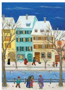
© Anita Rüfenacht, Switzerland - in der Stadt (Phantasie)